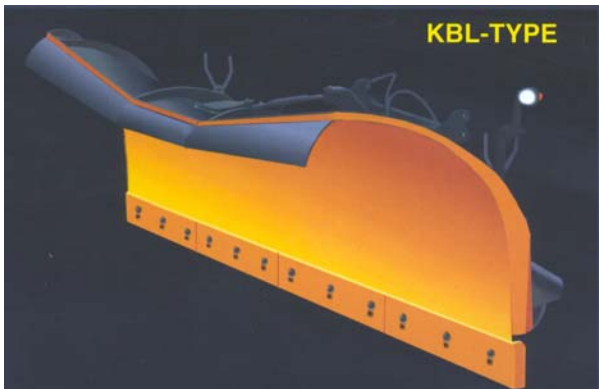
Kommunalblad med fjærende skjær

diagonalstilling. Skjæret har godt overbygg mot overkast. I tillegg kan 250 mm gummiskjerm mot oversprut leveres som ekstrautstyr. Som standard leveres kommunalbladet med 4 ører for parallelogramfeste. Tilleggsutstyr for kommunalblad: Gummiskjerm mot oversprut. Tallerkensett justerbare, tallerkener i hardox 500. Sancic hardmetall-tallerken, istedenfor hardox 500. Markeringslys m/ festebrackett og ledningsett, v-side. Hjul med gaffel og skjerm, høyre og venstre side. Diodelampe i markeringslykt, istedenfor pære. Påsveist hurtigkobling type Østfold. BM hk-feste, istedenfor 4 ører. 3. støttelabb, venstre side (teleskopspindel, med ski og såle). Parallelogramfeste komplett. Kileboltsett. BM hk-feste (bildel) m/ hydrauliske låsebolter.