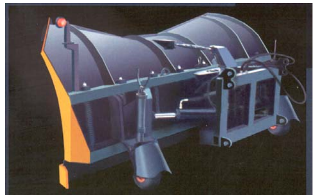
Vist med hjul som ekstrautstyr